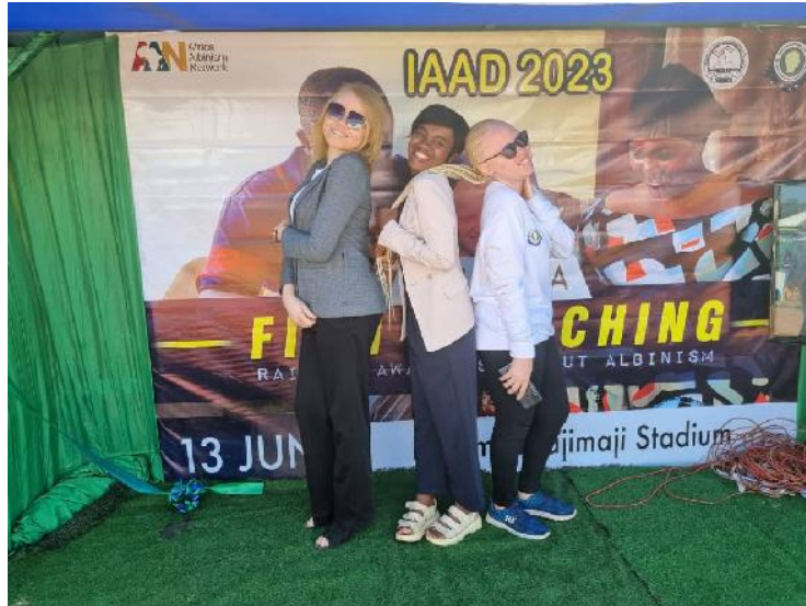
El equipo de realizadores en la presentación del video.

“Estamos muy orgullosas de haber participado en este proyecto. Nos divertimos y aprendimos cosas nuevas a lo largo de la experiencia”.