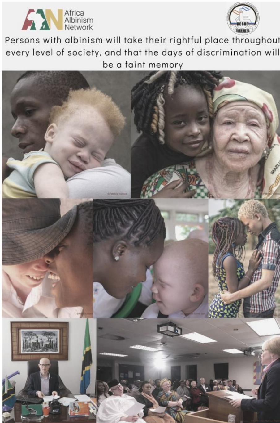
Le rêve du Réseau Africain de l'Albinisme élaborée il y a un an, en 2022.

Le Réseau africain de l'albinisme (AAN) est heureux de lancer son film à l'occasion de la Journée internationale de sensibilisation à l'albinisme (IAAD). D'autant plus que, ce même jour, a été lancé le plan d'action national tanzanien (PAN) sur l'albinisme. L'approbation du PAN par le gouvernement est une étape importante pour l'AAN.